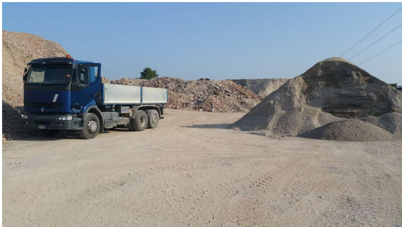
13 vista interna all'area attualmente utilizzata per lo stoccaggio dei materiali