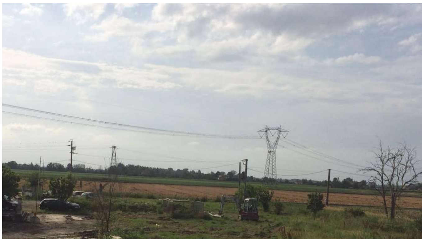
16 vista dall'area verso la Strada Cavo Argine