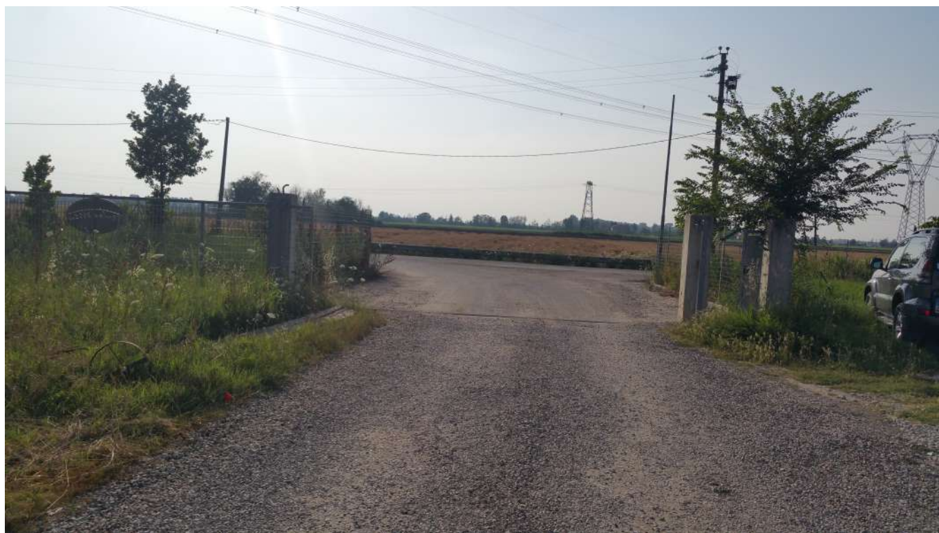
9 vista dell'ingresso di accesso all'area