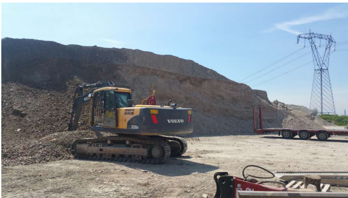
12 vista del cumulo di materiali di altezza superiore i 10 m