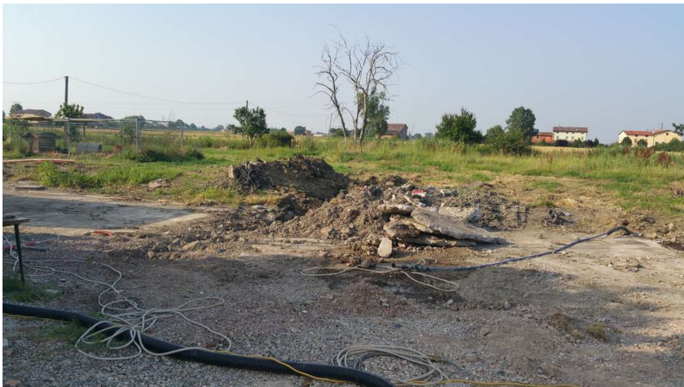
17 vista verso le abitazioni a Nord dell'area