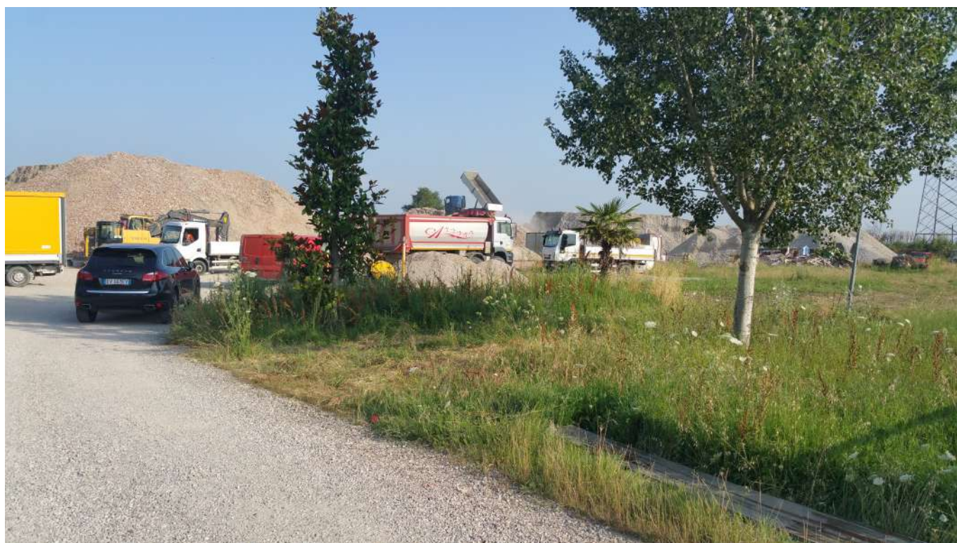
10 vista dall'ingresso all'interno dell'area attualmente utilizzata per lo stoccaggio di materiali