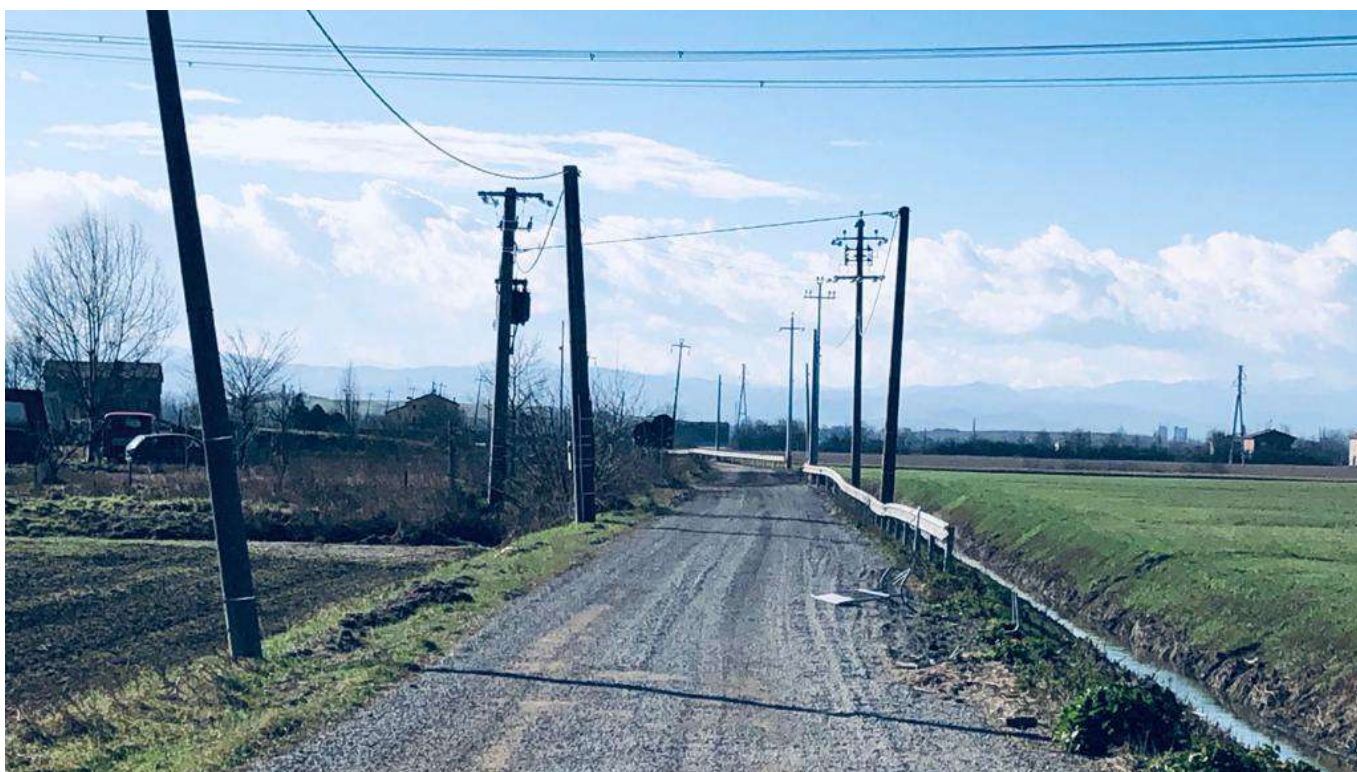
4 vista a Nord dell'area dalla Strada Cavo Argine