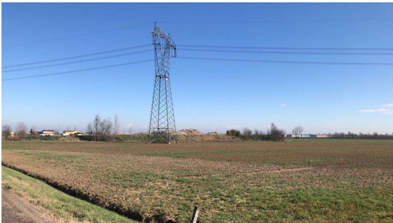
3 vista a Sud dell'area dalla Strada Cavo Argine