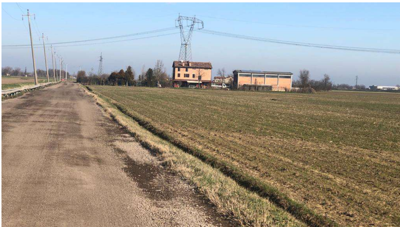
vista delle abitazioni a Sud dell'area