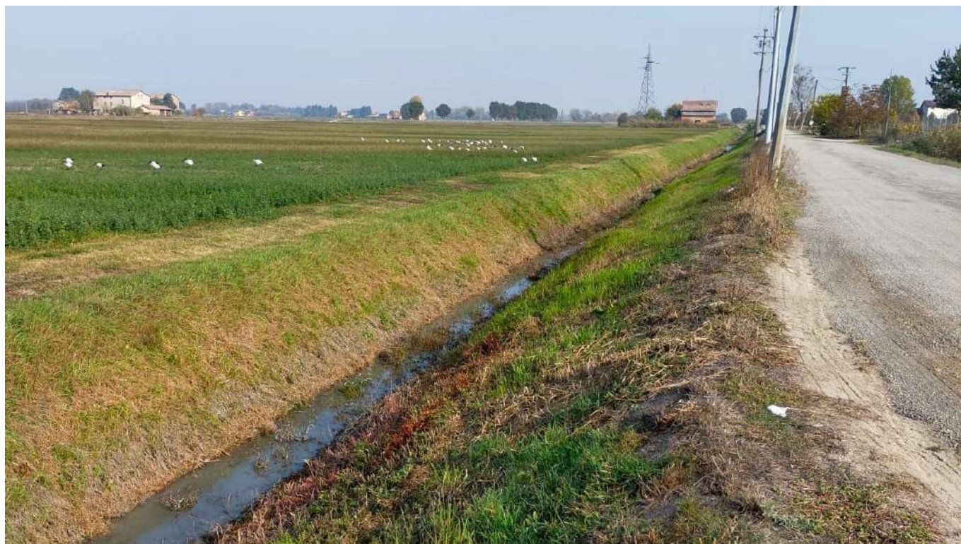
1 vista verso Nord del Cavo Argine