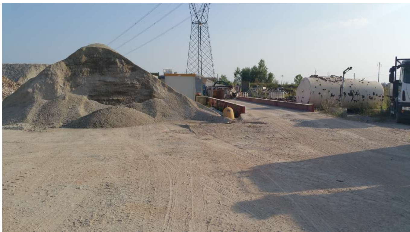
14 vista interna all'area attualmente utilizzata per lo stoccaggio dei materiali