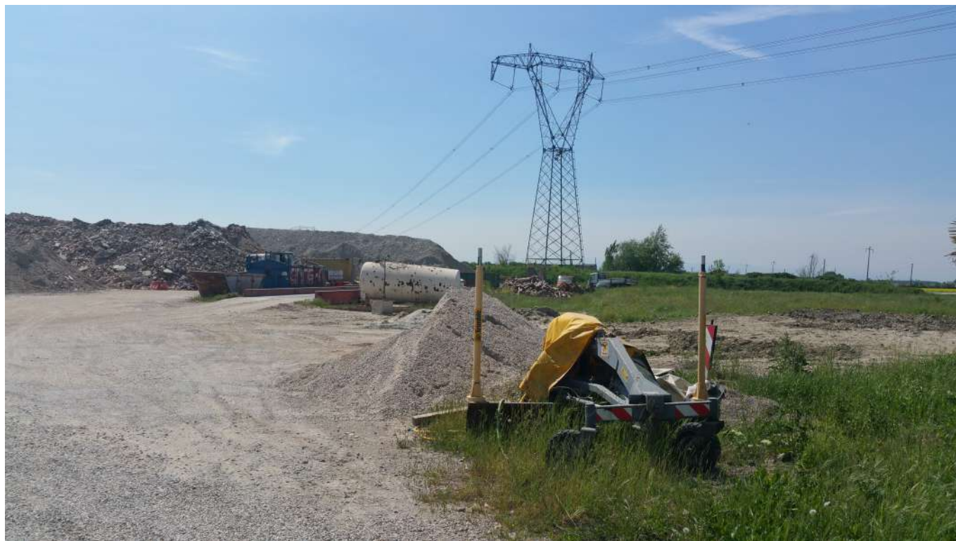
15 vista dell'area in rapporto alla linea elettrica di alta tensione e la duna esistente sul confine a Sud