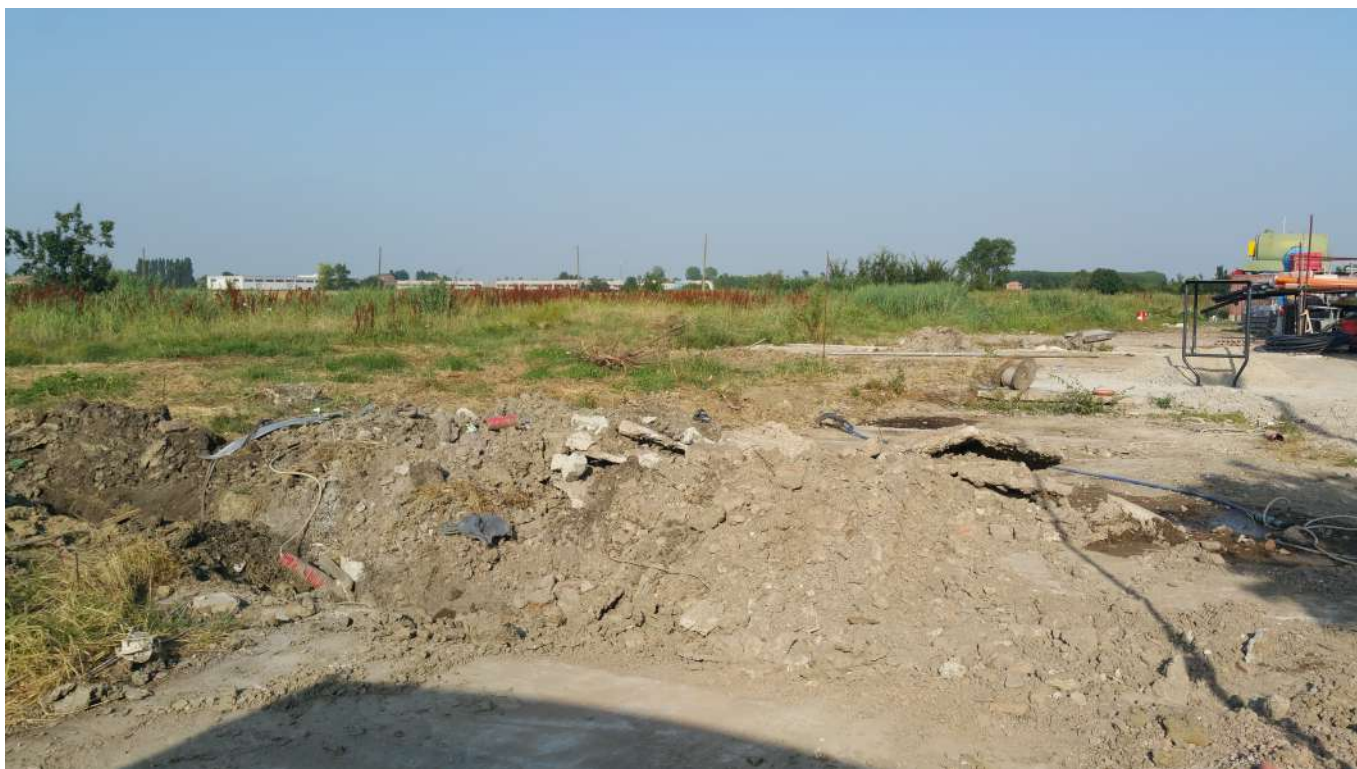
18 vista verso il comparto produttivo di Villavara a Ovest dell'area