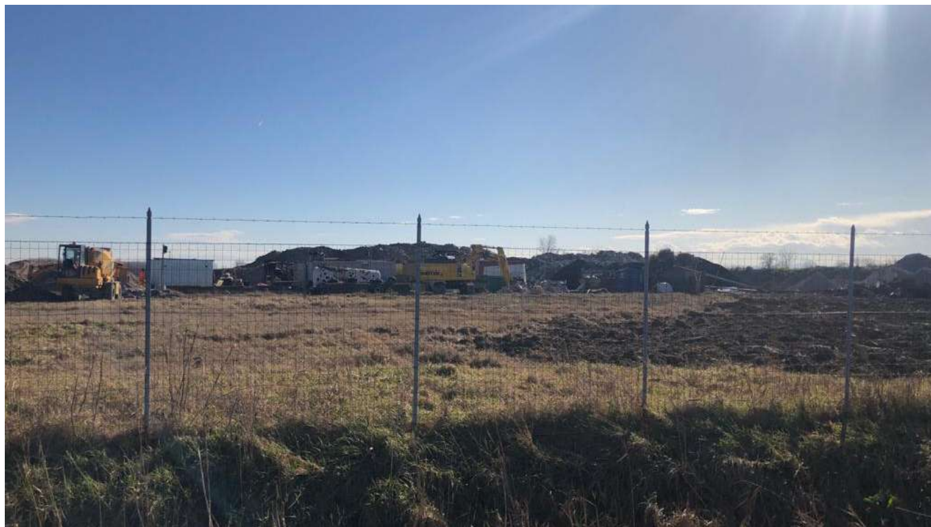
5 vista dell'area dalla Strada Cavo Argine