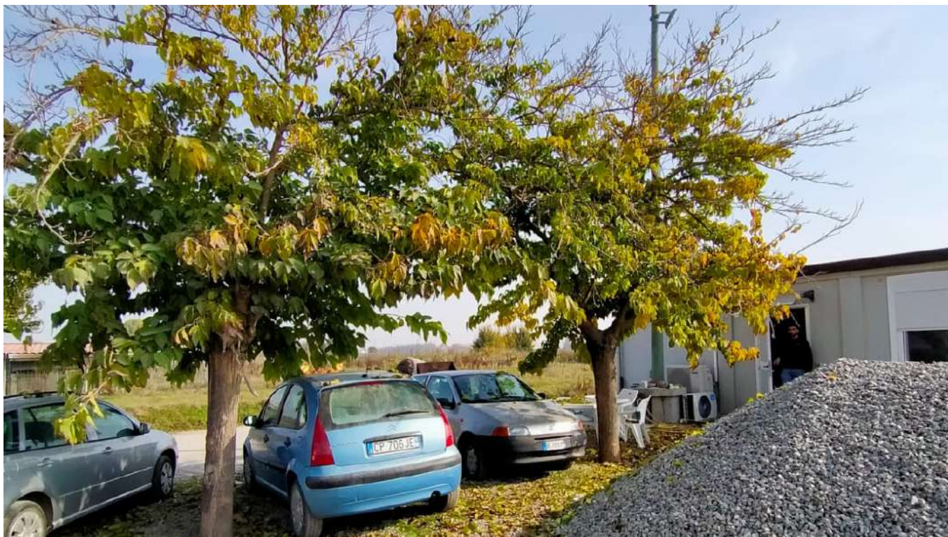
11 vista interna dell'area