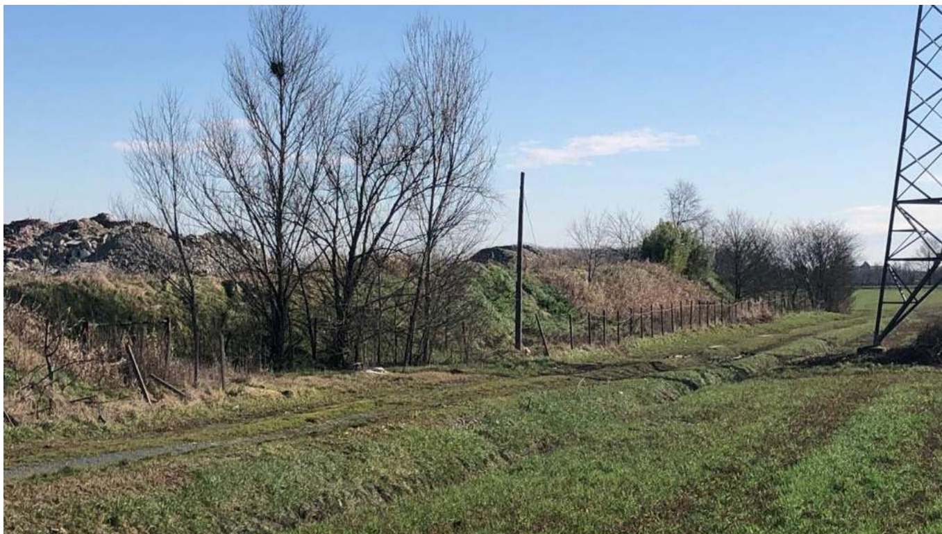
7 vista dello stradello che costeggia l'area a Sud, tra la recinzione sul confine di proprietà e il traliccio linea elettrica.