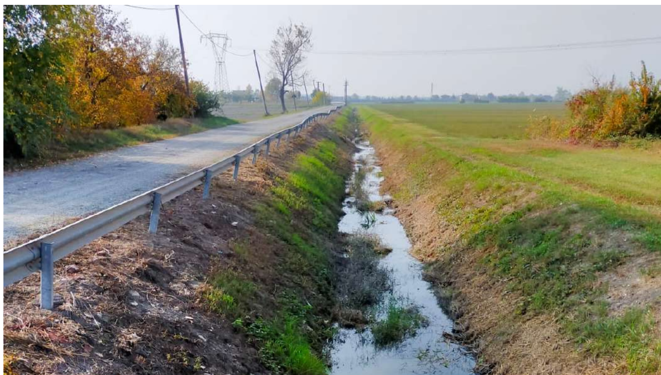
vista verso Sud del Cavo Argine