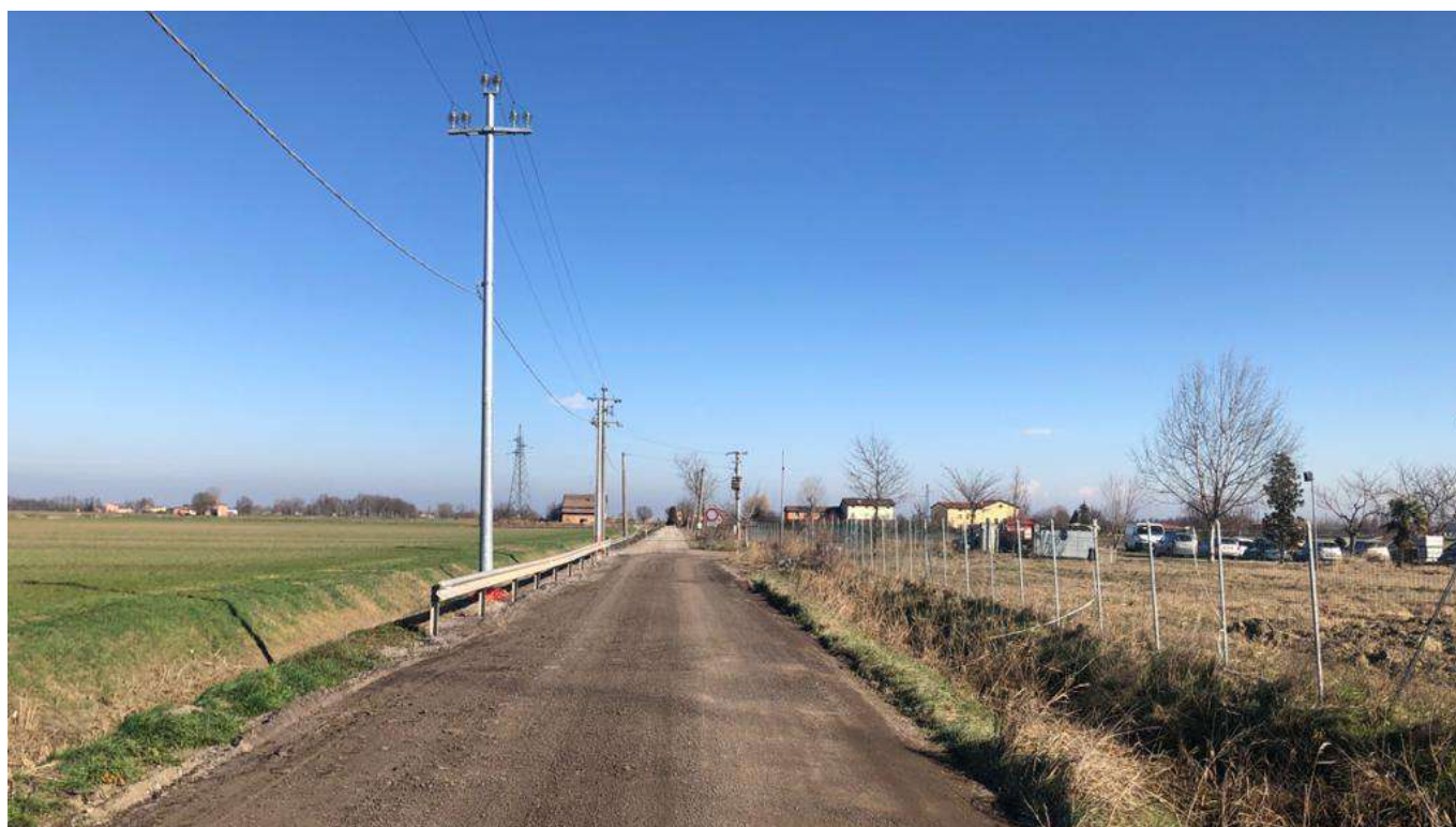
6 vista del Cavo Argine dalla Strada Cavo Argine, sulla destra l'ingresso di accesso all'area